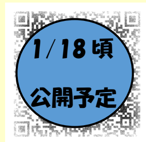
登録フォーム用 QR コード