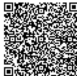
登録フォーム用 QR コード