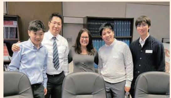
UCLAでの短期研修あり（希望者）