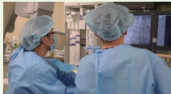
↑心カテ中。一人で最初から最後まで検査します。

医師、看護師、その他コメディカルはもちろん、事務方、掃除の方まで皆さんすれ違つと必ず笑顔で挨拶してくれます。毎日病院に来るのがとても楽しいです。