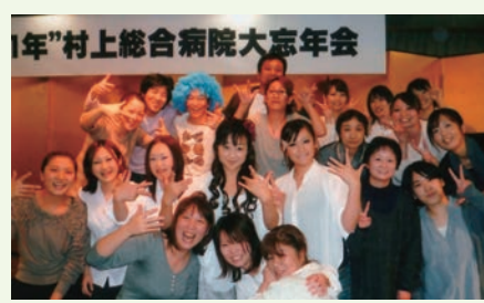
←楽しい飲み会もたくさんあります☆